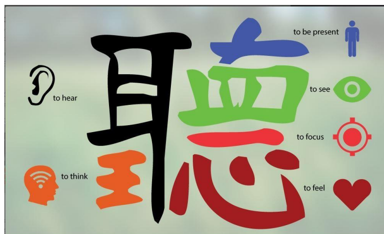
Рис 1. Традиційний китайський символ «tīng»

Скетчноутинг (від англ. «sketch» – ескіз, зарисовка) – спосіб структурування інформації, що сприймається на слух, або фіксація власних думок за допомогою скетчнотаток, під якими М. Роде розуміє «яскраві записи, створені завдяки поєднанню рукописного тексту, малюнків, текстового оформлення форм та візуальних елементів, як-от: стрілки, рамки та лінії» (Роде, 2019: 23). Скетчнотатки створюються в режимі реального часу впродовж лекції, презентації, розмови чи обговорення, вони допомагають зосередитися та задіяти одночасно два канали: вербальний і невербальний – та, спираючись на теорію подвійного кодування, структурувати матеріал. Дуже важливим для візуалізації інформації стає вміння активного слухання. Тут доречно згадати традиційний китайський символ «tīng», що означає «слухати», складові частини якого ілюструють суть гарного слухання (рис 1).